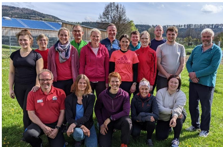
Dezentrale Sportabzeichen-Prüferausbildung im Unterbachgelände, 20.06.2023