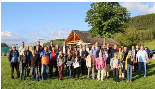
DSA-Ehrungen für 2019 und 2020