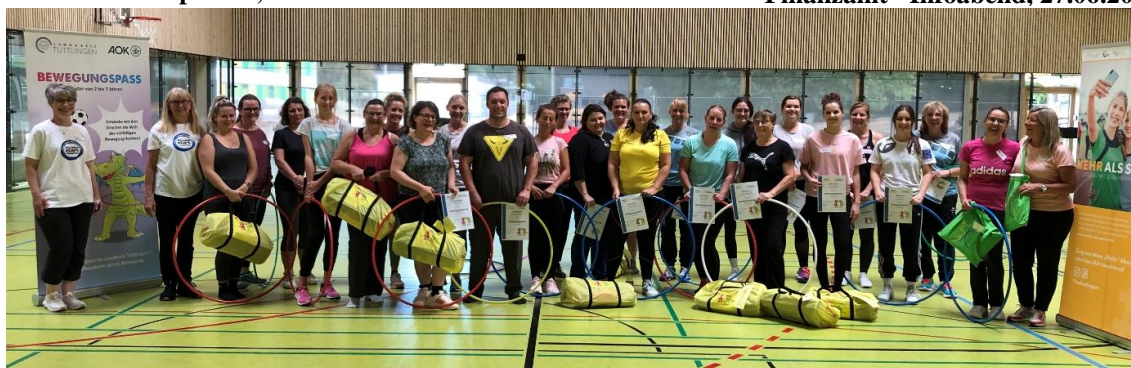
"Bewegungspass" in der Kreissporthalle Tuttlingen, 16.09.2023