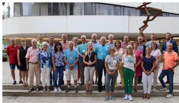
DSA-Ehrungen für 2022