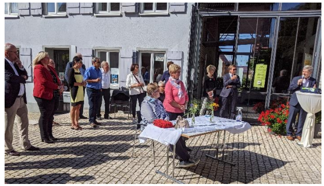
"Sportkreisjubiläum 70+1" 18.09.2021, Kolbingen