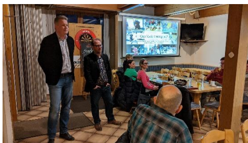
"Quo Vadis Lokalsport?", 02.03.2023