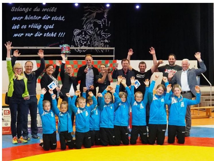
Siegerehrung 10.09.2022, Sporthalle Winzeln