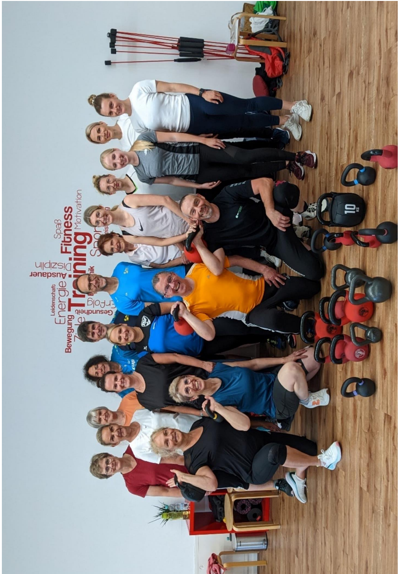
14.06.2024 GIB 3.0, „Kettlebell–Ganzkörpertraining durch natürliche Bewegungen“ im Personal Studio Madeleine Lehmann, Wurmlingen