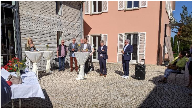
"Sportkreisjubiläum 70+1" 18.09.2021, Kolbingen