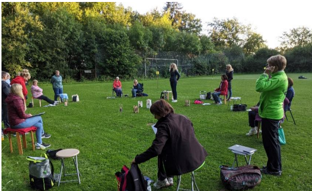
GIB 2.0 "Leb dein bestes Leben" 27.08.2021, Dürbheim