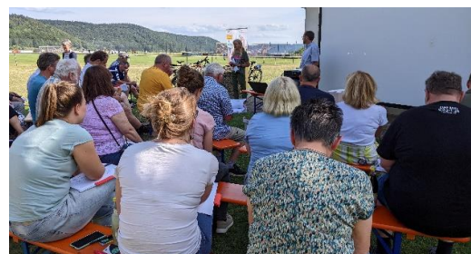
"Finanzamt" Infoabend, 27.06.2023