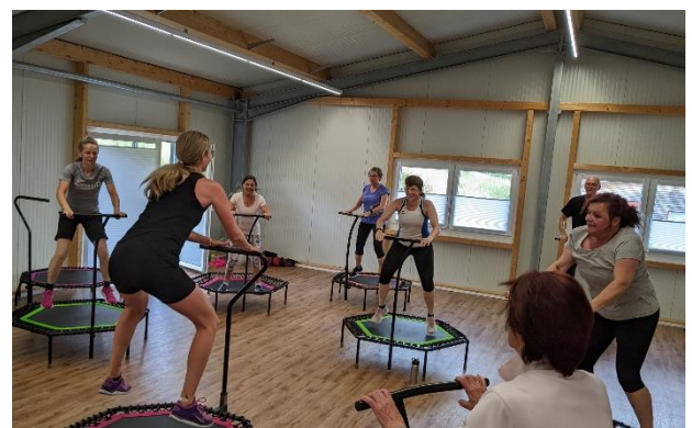
GIB 2.0 "Jumping Fitness" 01.07.2023, Wurmlingen