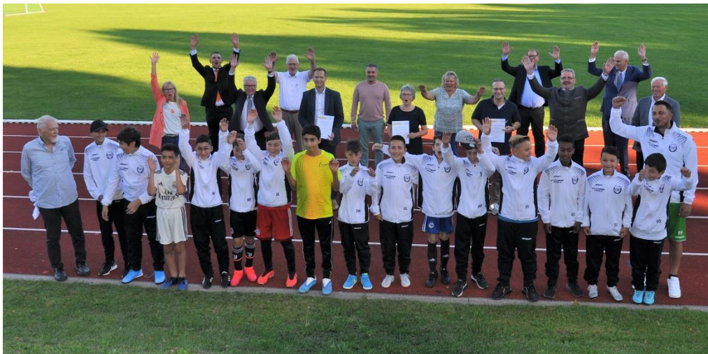
Siegerehrung, 08.09.2020, Vereinsheim FSV Schwenningen

Der Skiclub Fridingen erzielte mit seinem Angebot für Kinder und Jugendliche den dritten Platz.