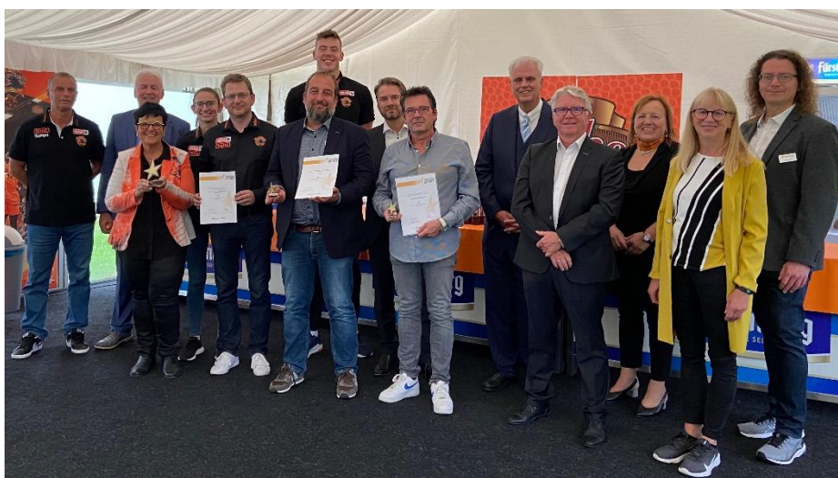
Siegerehrung, 16.09.2021, Sportzentrum Deutenberg Schwenningen