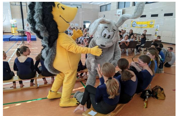
GIB 3.0 JUK-Auftaktveranstaltung, 21.06.2022, Weilheim