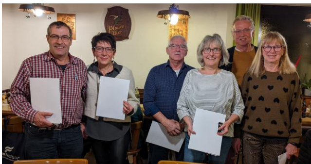
SK-Weihnachtssitzung mit WLSB-Ehrungen 12.12.2023, Rußberg