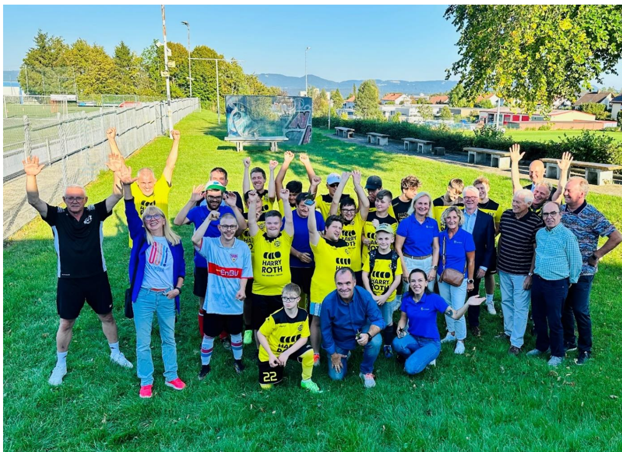
Siegerehrung 06.09.2023, Zimmern ob Rottweil