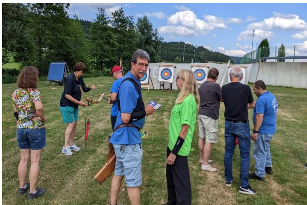
"GIB 3.0 Bogenschießen" 21.07.2022, Gosheim